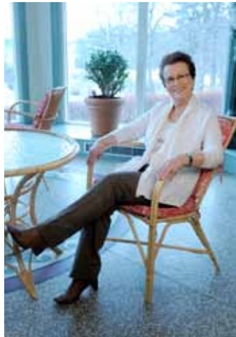
En mjuk kofta och bekväm byxa i råsiden sitter fint till vardags

klädd i hög kvalitet med material som gör att kroppen ser smalare ut. Klänningen kan kompletteras med en sjal eller scarf. Britt har ett par eleganta, högklackade skor för att förlänga benen.