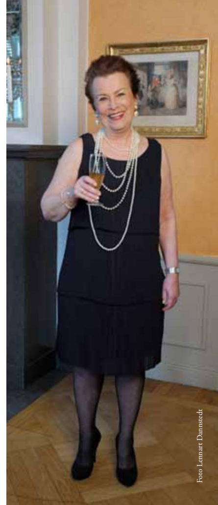
Britt i en enkel och elegant festklänning

Lolo valde en klassisk stil med pärlhalsband och öronclips. Klädseln ska vara stilren, menar Lolo, utan något plottrigt.