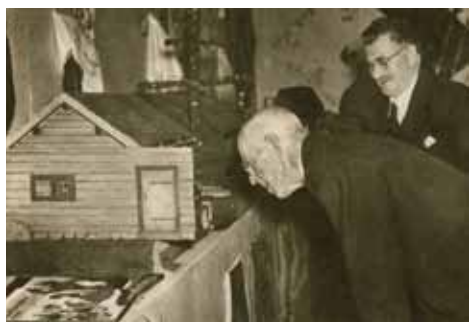
Gamle kungen, Gustaf V inspekterar miniatyrstugor utställda i Blå hallen under ”De gamlas utställning”.