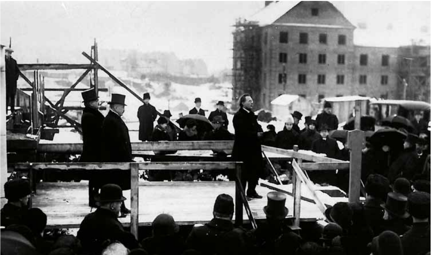
Ärkebiskop Nathan Söderblom invigningstalar på Röda bergen