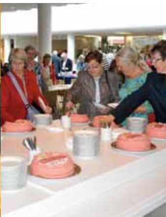
Stämmodeltagarna lät sig väl smaka av jubileumstårterna.