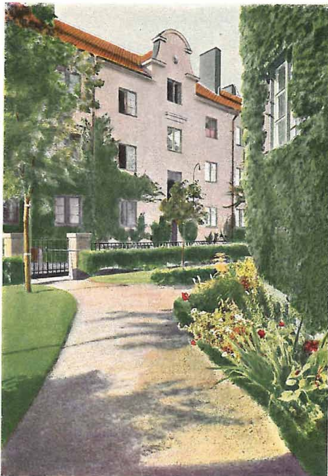
BLOMSTERGÅRDARNA, Rödabergsgatan 1-3, Stockholm.

Ett reklamvykort visar Blomstergårdarna på Röda bergen.