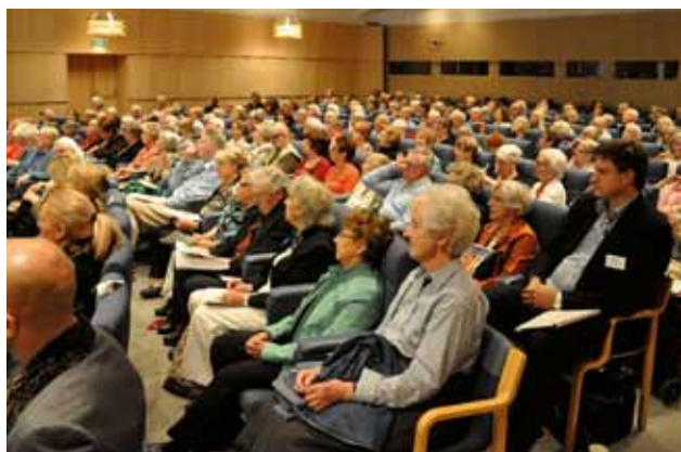
När alla väl tagit plats i hörsalen fanns inte en ledig stol att uppbringa.

”Om man, mot förmodan, skulle råka ha ett paraply uppkört i rumpan, så ska man verkligen låta bli att fälla ut det”