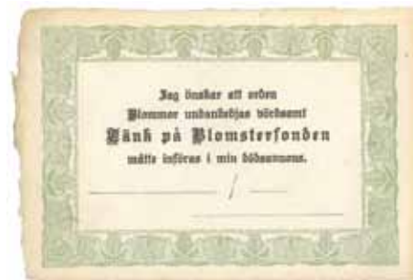
En sista önskan för underskrift.

I februari 1924 läggs första hörnstenen för vad som kom att bli Blomsterfondens första blomstergård (husen står helt klara 1926). Ärkebiskop Nathan Söderblom håller tal, där han nedkallar Guds välsignelse över föreningen samt över alla som kommer att leva och bo i blomstergårdarna.