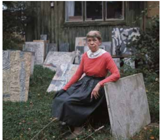
Siri Derkert i sin trädgård.