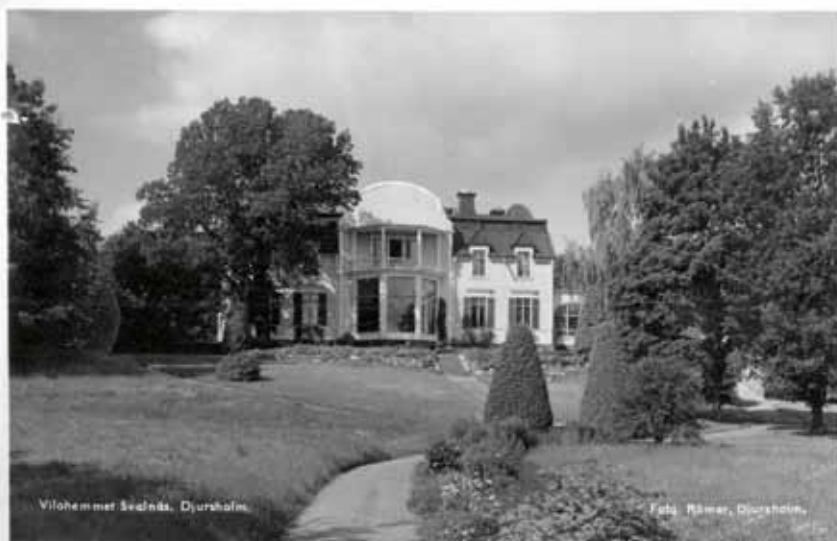
Vilohemmet Svalnäs, Djursholm.