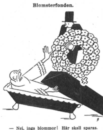
Blomsterhandlarna protesterar mot föreningen.

Men starten av Blomsterfonden var inte smärtfri. Gåvor och donationer kommer inte in i samma takt som man räknat med. Dessutom motarbetas Blomsterfonden av en sammanslutning trädgårds- och blomsterhandlare, som är rädda för att Blomsterfonden ska skada deras verksamheter. Trädgårdshandlarna startar en massiv propagandaapparat mot fonden i den svenska pressen som håller i sig ända in i femtiotalet.