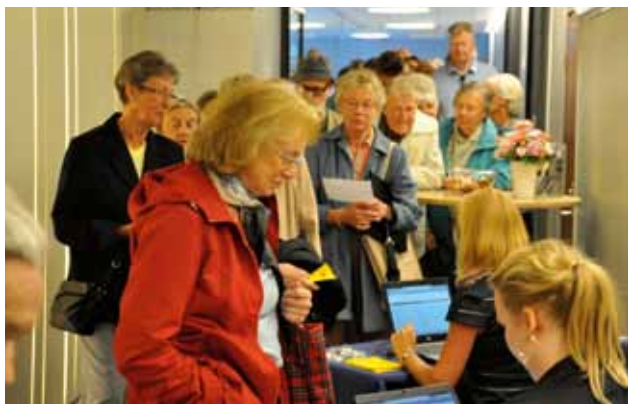
Kön ringlade lång till stämmans registratorer.