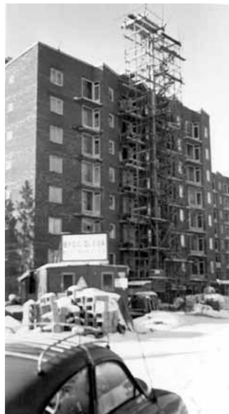
Uptill: Bygget av Liseberg är under full gång.

... år 1948 förvärvat av Stadsmissionen som den 1 april samma år där öppnade ett gästhem.