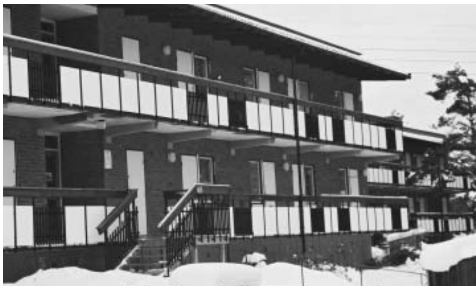
På Sylvestergatan har husen fått nya räcken.