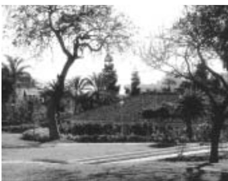
Utsikt från Villan