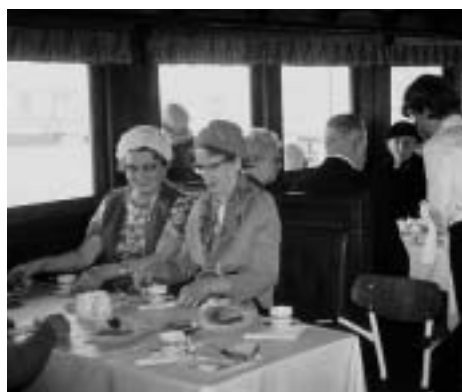
Till vän. En trevlig lunch ombord på båten under utflykt till Vaxholm -67. Till hö. Mannekänguppvisning på Liseberg någon gång på 60-talet.