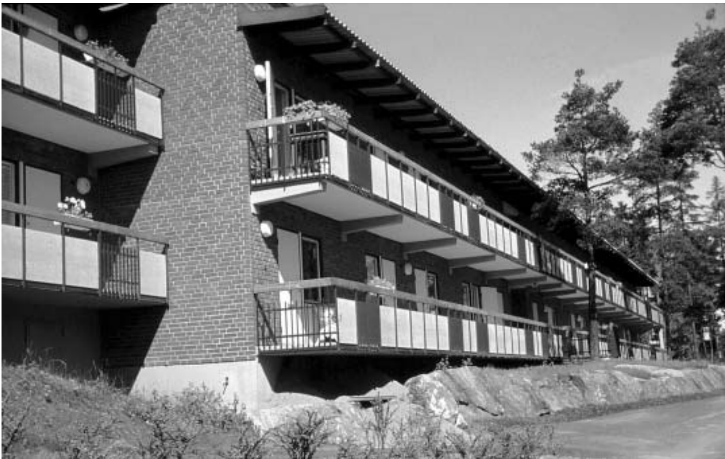
Loftgångshuset färdiga och inflyttningsklara 1963-64.

Blomsterfonden vill dessutom aktivt medverka till att yrken som är knutna till vård och omsorg ses som de framtidsyrken de är. För trots all modern teknik så är och förblir personalen grundstenen i vårdverksamheten, och därmed i Blomsterfondens.