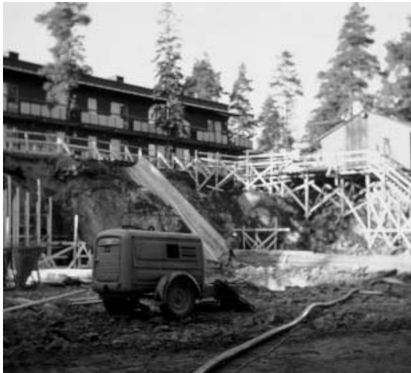
Nya sjukhemmet på Liseberg byggs 1971.