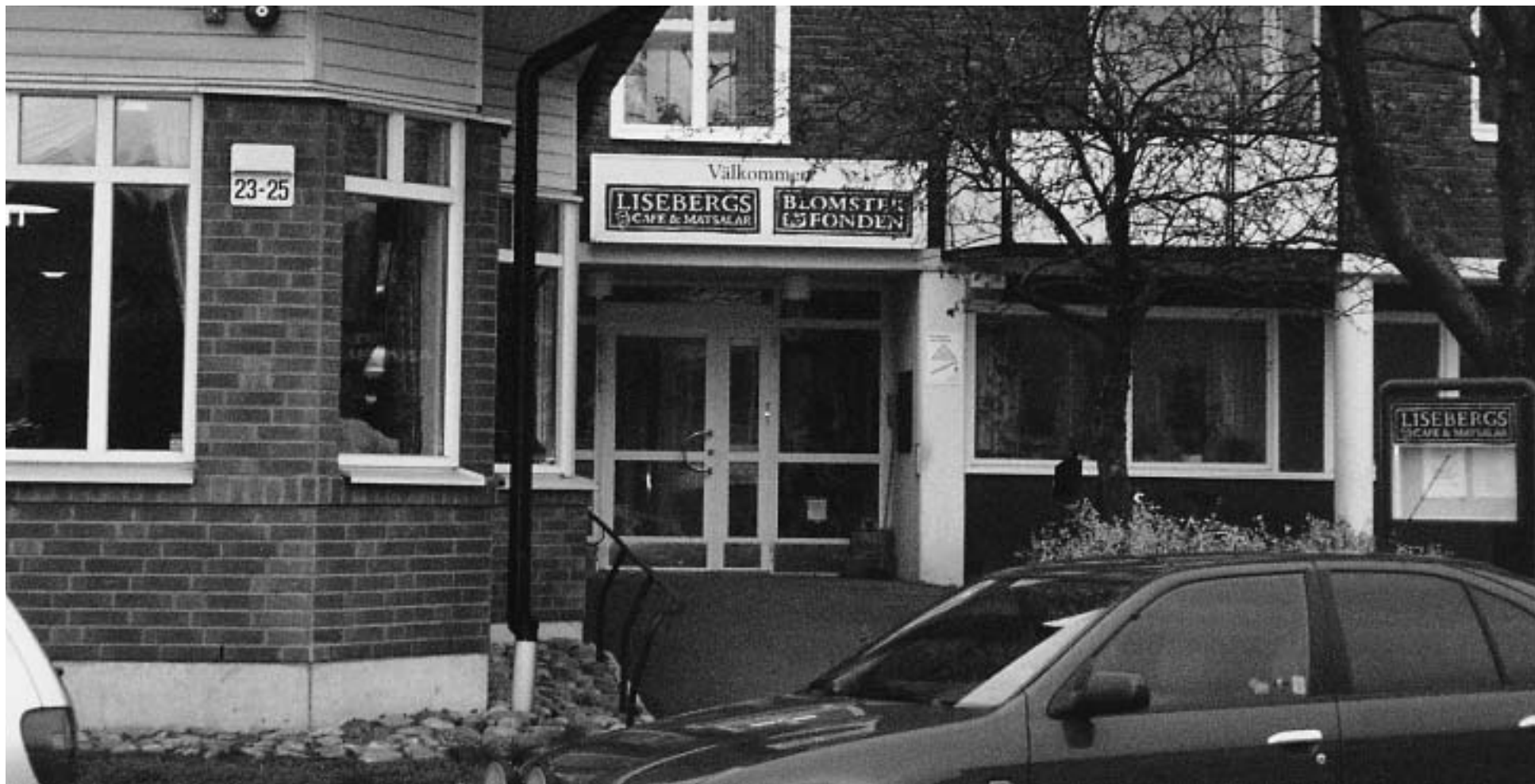
Entrén till Liseberg på Annebodavägen 23-25. Sammanlagt 345 lägenheter. Mycket välkommen!

I vår serie presentationer av de olika blomstergårdarna har turen nu kommit till Liseberg. Husen byggdes på 50-talet och nu sker en upprustning av bl a sjukhemsboendet.