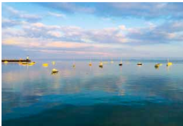
Att sitta och äta ostron i Cancale en kväll som denna är ett minne som förfyller många mörka vinterkvällar.