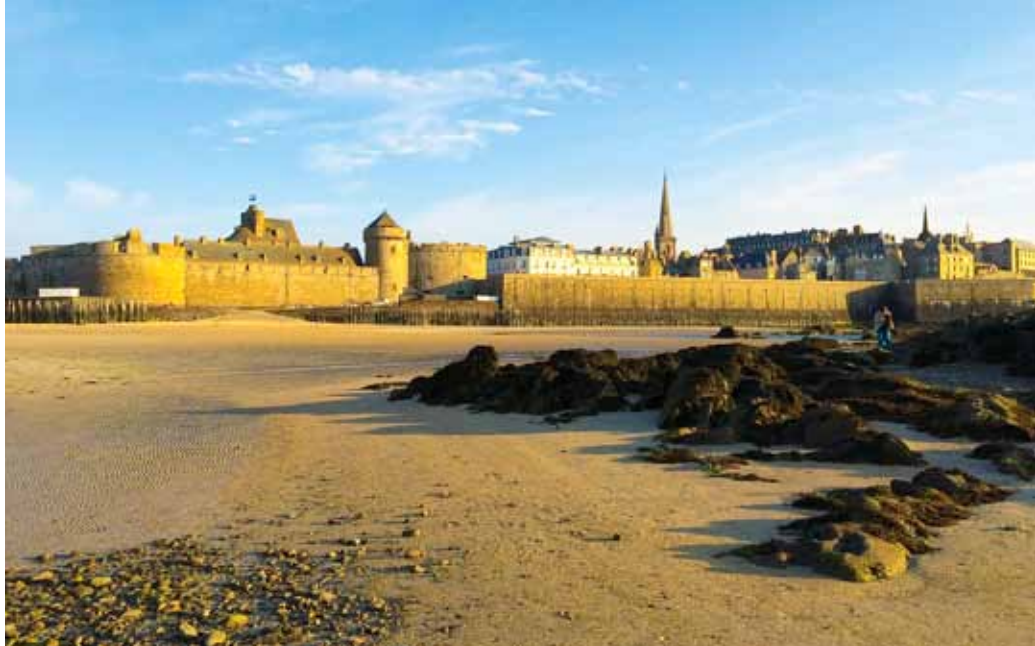
Den gamla staden är omgärdad av en ringmur som i gångna tider skyddade mot fiendeanfall. Bland annat från vikingar och sjörövare. Piraterna gjorde dock staden till sin egen under lång tid.

St Malo har runt femtiotusen invånare och är rätt stor i sig, men det är den gamla delen som är den intressanta, så det bästa är att bo nära till denna. Vi hade inte mer än fem minuters gångavstånd till den gamla staden, där vi bodde