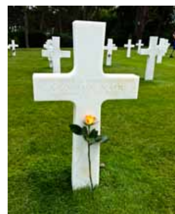
Många var de amerikanska, engelska och kanadensiska unga män som fick sätta livet till under de allierades landstigning i Normandie. Deras minne hedras varje dag av tusentals människor som besöker och lägger blommor på deras gravar.

Att ta sig till och från St Malo är inte speciellt svårt. Kör man inte bil kan man göra som vi. Ta tåget direkt från Charles De Gaulle, byta i Rennes, vara framme på drygt fyra timmar och ha härliga dagar framför sig.