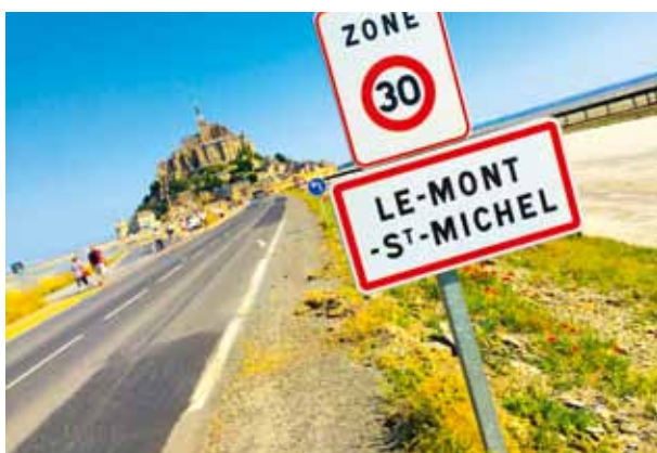
Ett besök i det gamla munkklostret Mont-St-Michel är ett måste om man besöker dessa trakter.

strax utanför murarna. Fördelarna med det är att man slipper nattstojet och betalar ett mycket lägre pris. Vi tog in på ett litet familjeägt lägenhetshotell: L'Adresse - snyggt, fint och väldigt trevlig och hjälpsam personal. Kostade ungefär tusen kronor dygnet för ett dubbelrum.